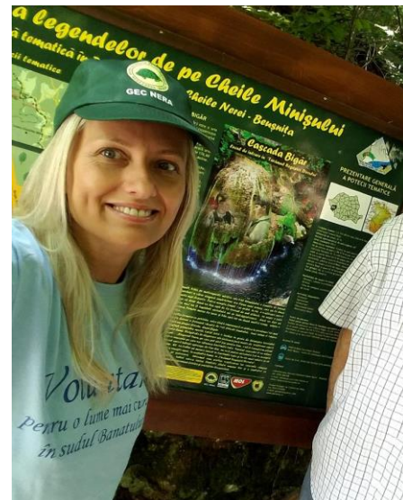
Punctul de informare ecoturistică al GEC Nera din interiorul rezervației naturale Izvorul Bigăr.

Secțiune realizată de Alin Țușan - coordonator al centrului de voluntariat al GEC Nera