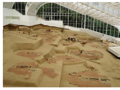
Situl arheologic Lepenski Vir

comunitățile culegătorilor care s-au stabilit pe terasa Lepenski Vir au avut relații sociale complexe și un stil unic de arhitectură și sculptură monumentală modelată pe pietre uriașe. În toate habitatele, săpăturile arheologice au scos la iveală 136 obiecte cu o formă trunchiată la un unghi de 60 de grade.