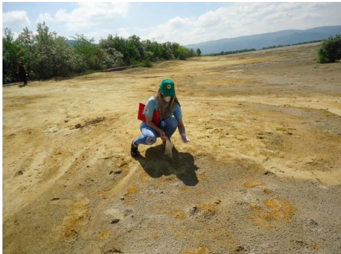
Recoltări de probe de praf la depozitul de deșeuri miniere Tăușani - Boșneag din Moldova Nouă

Exemplarele de lăstun de mal (Riparia riparia) au părăsit în mare parte habitatul rezervației Râpa cu Lăstuni - Valea Divici de pe teritoriul comunei Pojejena. Pe parcursul monitorizării s-a constatat prezența acestora în abrupturile din golful Dunării de la Baziaș.