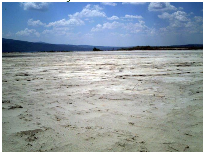
Praf ce urmează a fi „irigat” de Ministerul Economiei pe suprafața depozitului de deșeuri miniere de la Moldova Nouă.

seamănă cu un peisaj lunar, soluția de stopare a poluării găsită de Ministerul Economiei constă în umectarea iazului cu instalații de stropire folosite în irigarea culturilor agricole, și ar fi urmat ca potrivit deciziei CJCE să fie finalizată în luna august 2018.