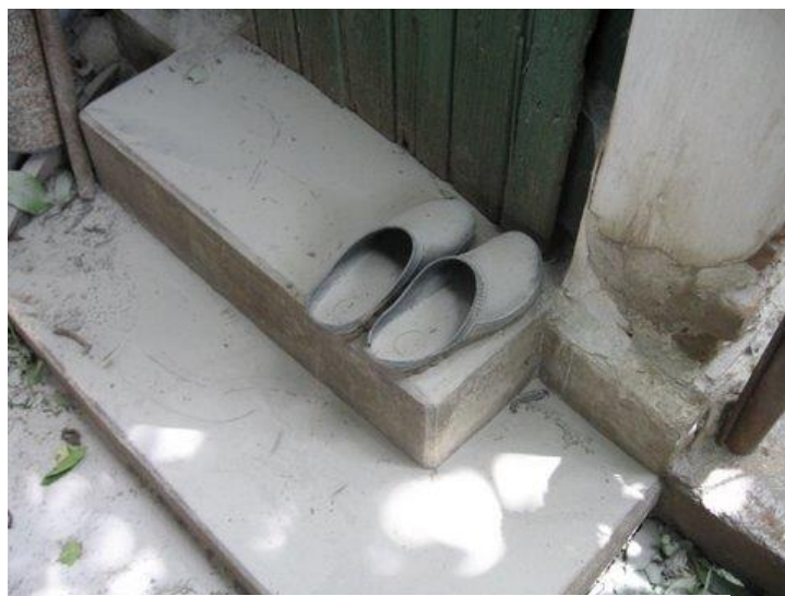
Praful toxic de deșeuri miniere ajuns pe obiectele din gospodăriile populației dar APM Cara - Severin .....nu a constatat în timp depășirea limitelor de praf în aerul din Clisura Dunării.

Oficialii afirmă corect că este vorba de o soluție provizorie pentru conformare la decizia CJUE iar GEC Nera mai adaugă că soluția tehnică este una mai degrabă pompieristică și improvizată, care nu are legătură cu realitatea din teren și prin care se cheltuiesc cca 1,7 milioane de Euro de la bugetul stat.